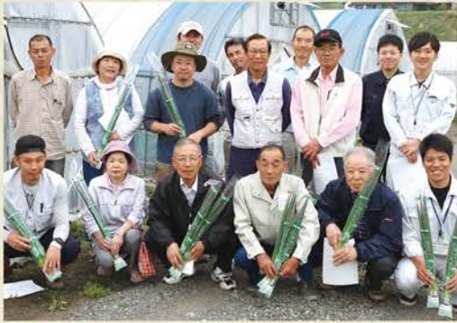
広島県庄原市 西城町野菜生産協議会 青ネギ部会 私たちが心を込めて作っています。

最高等級の広島ねぎを 一番良い品質でお客様に 食べて喜んで頂きたい! そんな生産農家の方々の 想いが込められています。